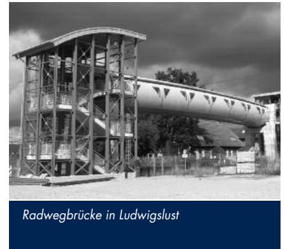
Radwegbrücke in Ludwigslust

Dipl.-Ing. Andrea Bickel (Planung Freianlagen, Ausschreibung) IBD Ingenieurgesellschaft mbH, Raben Steinfeld