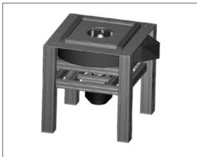
Spreuaufbereitungs- und Verteilvorrichtung