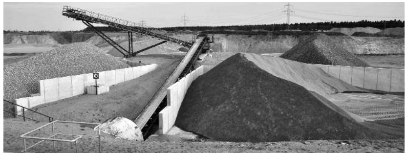
Schüttgutumschlagplatz mit Gleisanschluss, Kieswerk Consrade